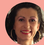
Alexandra Vives Distri Club Médical

« Afin de dynamiser la communication locale de nos magasins, nous avons créé un magazine en ligne autour d'une valeur commune : « le bien-être ». Cette stratégie digitale fédère nos franchisés, nos prescripteurs et nourrit notre relation client. »